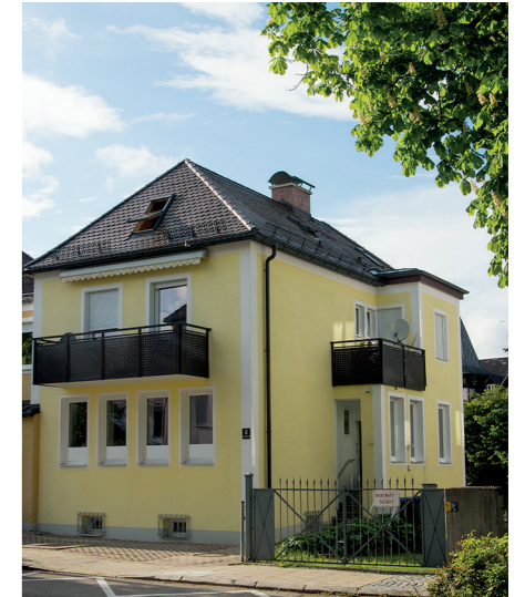
Unsere Räume in der Crailsheimstraße 6

Selbsthilfegruppen sind kostenlos und offen für jeden.